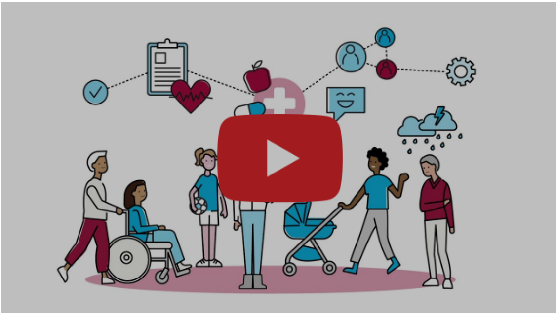
Zorg in de toekomst- scenariodenken

Bekijk onderstaande video en de pagina met tools en inspiratie .